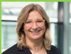
Energieministerin Anke Rehlinger

„Gesamtgesellschaftliche Aufgaben wie die Energiewende sind nur Hand in Hand mit den Kommunen zu schaffen, denn Umdenken und Umsetzung beginnen vor Ort. Umso erfreulicher sind Veranstaltungen wie die heutige Energiemesse in Schiffweiler. Sie zeigt eindrucksvoll, was möglich ist, wenn Gemeinden die Initiative ergreifen und regionale Akteure zusammenbringen.“