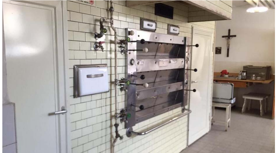
Nur BAELETC konnte einen sogenannten altdeutschen Dampfbackofen in einem Kloster in Bayern noch reparieren, die Anfang des 19. Jahrhunderts noch modernste Technik waren und traditionelle Backöfen mit feuererhitzten Backofensteinen ablösen.

wird ein Ofen ausgebaut und die Reparatur in den eigenen Räumlichkeiten vorgenommen. Da die Betriebsstätte von BAELETC nunmehr dem gewachsenen Geschäftsumfang nicht mehr gerecht wird, soll im neuen Gewerbepark Truckenbrunnen in Spiesen-Elversberg ein moderner Firmenstandort entstehen, der für die Zukunft alle Möglichkeiten einer kontinuierlichen Weiterentwicklung des Unternehmens gewährleistet.