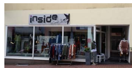
Inside Mode Für Sie, zu finden in der Hauptstr. 47, schräg gegenüber von MEN's Mode für Ihn.

Termin: Die Wirtschaftsförderungsgesellschaft im Landkreis Neunkirchen mbH (WFG) lädt ein: