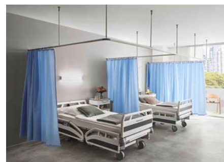
Die Sichtschutzsysteme von ropimex® sind insbesondere in der Medizinbranche gefragt.