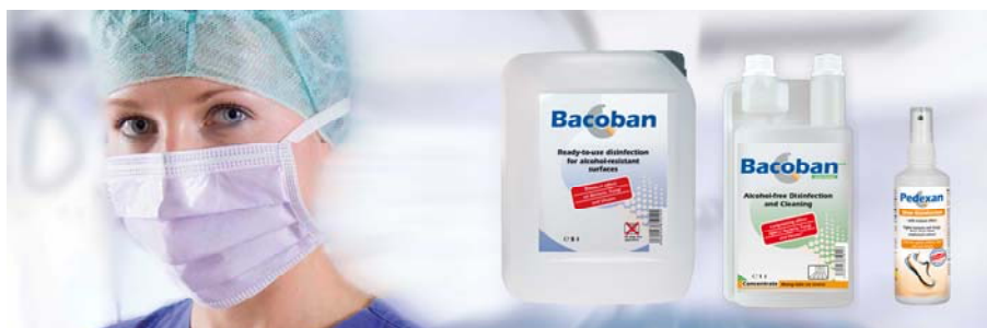
Mit der Produktlinie Bacoban wurde ein Desinfektionsmittel mit Langzeitwirkung auf den Markt gebracht. Sehr gefragt bei Fluggesellschaften zur Anwendung in Flugzeuginnenräumen.