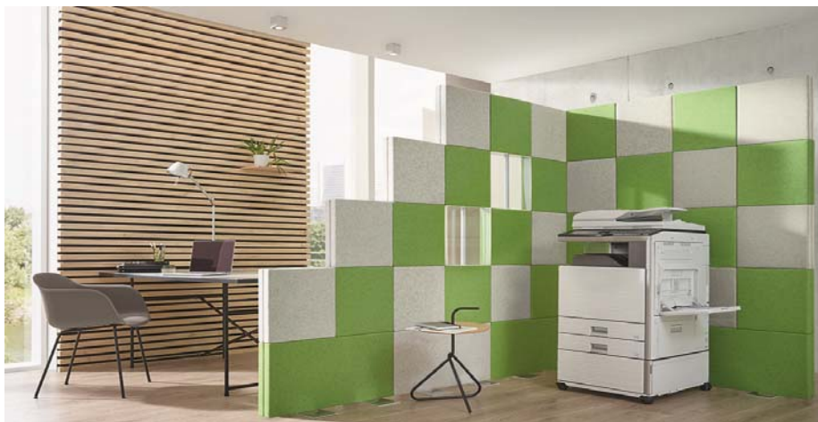
Sichtschutz, kombiniert mit Schallschutz. Modular, flexibel, lichtdurchflutbar und insbesondere schallabsorbierend - ropimex® bietet individuelle Lösungen nach dem Baukastenprinzip.

Neben dem Sichtschutz im Medizinbereich hat sich ropimex® auch mit anderen Schutzsystemen einen Namen gemacht. Im Bereich Wand- und Deckenschutz bietet ropimex® vielseitig einsetzbare Profile und Verkleidungen. Ein gänzlich anderes, aber dennoch Schutzmaßnahmen dienendes Geschäftsfeld, welches von der geschäftsführenden Ehefrau Jutta geführt wird, wurde mit Chemicals er-