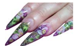
Fingernägel im Aquariumdesign

Zu jeder Existenzgründung gehören Selbstbewusstsein und Fleiß, basierend auf einer sorgfältigen Planung. Das Risiko kann damit trotzdem nur minimiert werden. Die Wirtschaftsförderungsgesellschaft ist stolz auf eine Existenzgründerin, die Mut zum Risiko bewiesen hat und die die Wirtschaftsstruktur des Landkreises im wahrsten Sinne des Wortes „verschönert“.