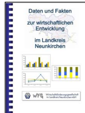
Sozialversicherungspflichtig Beschäftigte im Landkreis Neunkirchen nach Wirtschaftssektoren(*) in den Jahren 1996, 2000, 2006

Ganz besonders deutlich wird der Strukturwandel unserer Region bei der Betrachtung der Beschäftigten nach Wirtschaftssektoren. Die Gemeinden haben hier sehr unterschiedliche Entwicklungen, je nachdem wie ausgeprägt die Montanindustrie dort einmal war.