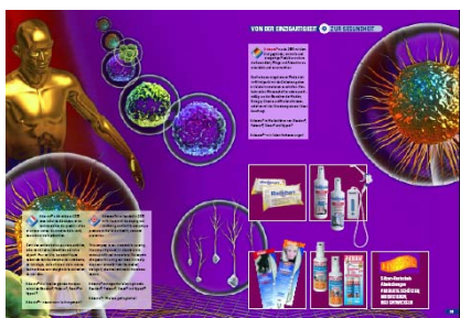
In auffälligen Farben und anspruchsvoll aufbereitet präsentiert sich die Adexano® Spezialprodukte für Gesundheit, Pflege und Prävention GmbH

Ganz nach der Devise „Bilder sagen mehr als Worte“ soll die Broschüre insbesondere durch ihre visuelle Aufbereitung überzeugen. Es sind interessante und teilweise auch überraschende Bilder, die zur Lektüre verleiten sollen. Wie auch Oberbürgermeister Jürgen Fried bei der Präsentation der Broschüre betonte, fungieren die beteiligten Unternehmen als „positive Image-träger und Boten für den Wirt-