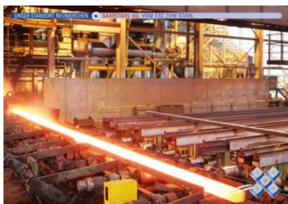
Glühender Stahl – ein immer wieder eindrucksvolles Bild und auch heute noch prägend für die Saarstahl AG am Standort Neunkirchen

Über 20 namhafte und erfolgreiche national und international tätige Unternehmen aus den verschiedensten Branchen stellen sich darin mit eindrucksvollen Bildern und ansprechenden Kurzbeschreibungen in den drei Weltsprachen deutsch, englisch und französisch vor.