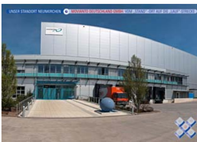
Das Firmengebäude der Movianto Deutschland GmbH – imposant in Szene gesetzt.

Die Broschüre wurde erneut von dem Grafiker und Designer Hans Huwer gestaltet und in einem hochwertigen Hochglanzformat aufgelegt. Mit einer Auflage von