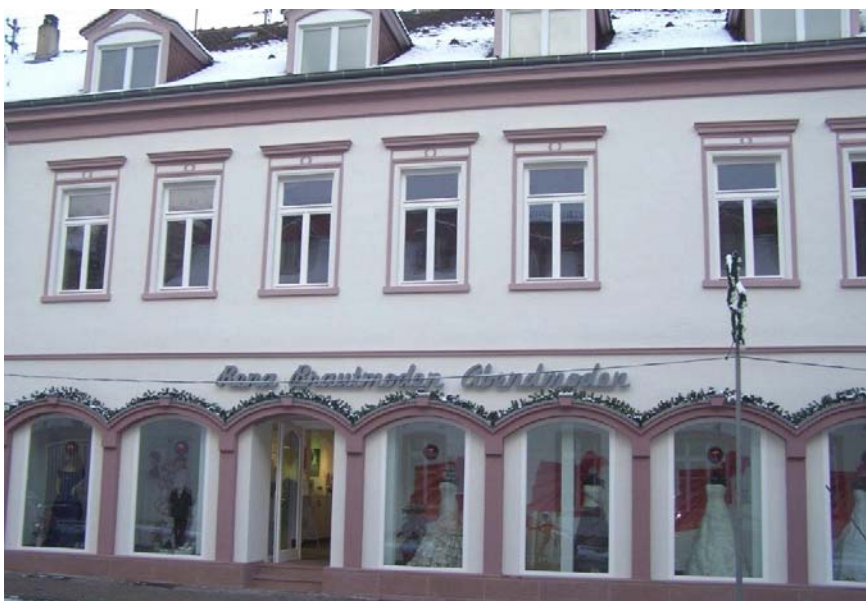
Eine Augenweide sowohl nach innen als nach außen: Die neuen Geschäftsräume im ehemaligen Ottweiler Kaufhaus gegenüber dem Landratsamt nach aufwendiger Umgestaltung der Fassade in Anlehnung an die Originalarchitektur aus dem Jahr 1900.

Ottweiler kann stolz sein auf ein wahres Aushängeschild im Bereich des Einzelhandels. Nicht nur eine stilvoll renovierte Fassade gegenüber dem barocken Landratsamt, die das Stadtbild bereichert, sondern insbesondere ein elegantes Geschäft, das auch in so manche Metropole passen würde. Profitieren kann davon die gesamte Stadt und insbesondere auch der sonstige Einzelhandel, denn so mancher Kunde von außerhalb wird von Rena Braut- und Abendmoden nach Ottweiler gelockt.