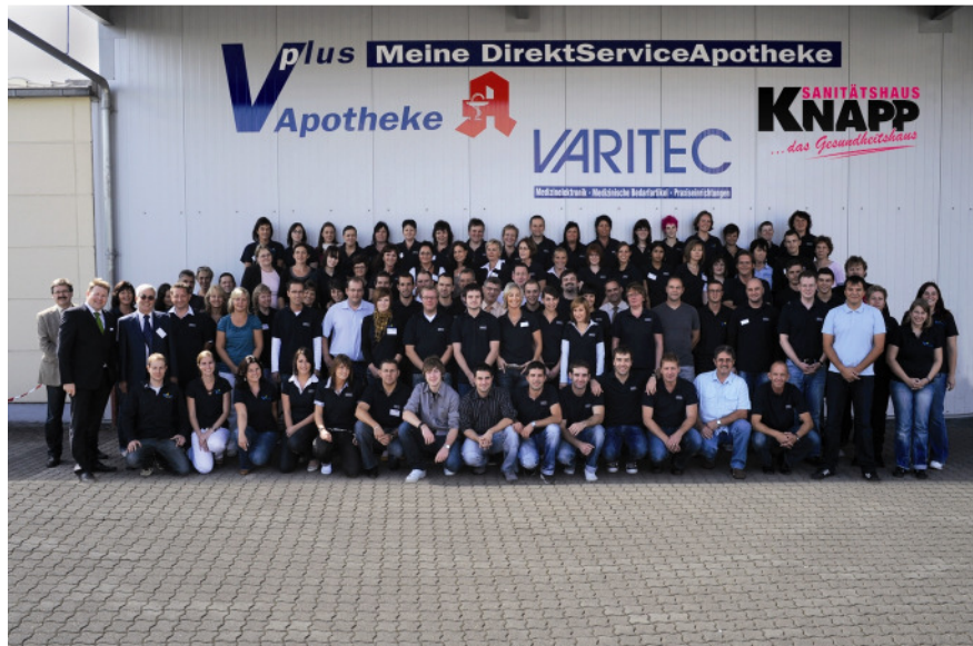
Im Firmenverbund der Varitec AG, der Vplus Apotheke, der Felix Knapp GmbH und der VplusCare Sanitätshaus GmbH sind mehr als 130 Mitarbeiterinnen und Mitarbeiter für das Wohlergehen der Patienten im Einsatz.

Der neu entstandene Firmenverbund kann mit seinem umfassenden Leistungsspektrum, den breit gefächerten Qualifikationen seiner Mitarbeiter, sowie den Synergieeffekten durch fachübergreifende Kompetenz alle Versorgungs-